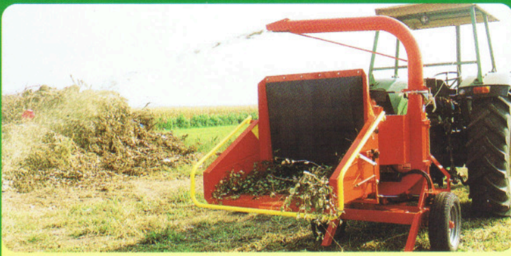
Cippo 25 ATTACCO PER TRATTORE