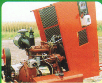
APERTURA COFANO ISPEZIONE MOTORE