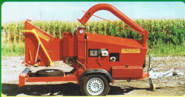
Cippo 25 STRADALE 80 KM/h